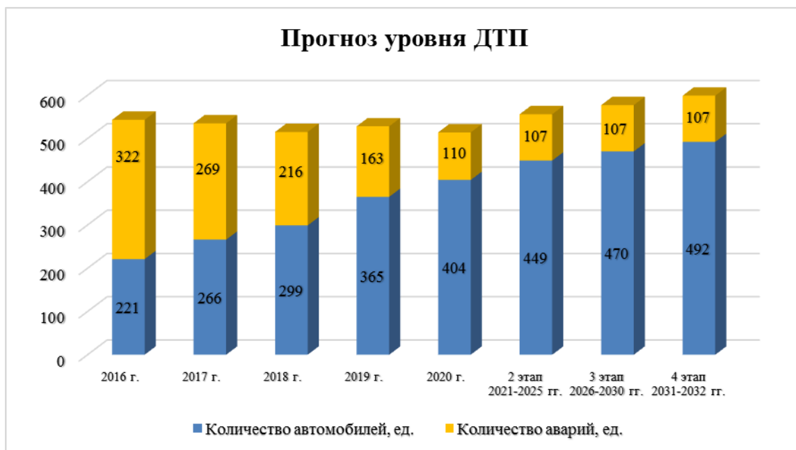
Диаграмма 7. Прогноз уровня ДТП Муниципального района.