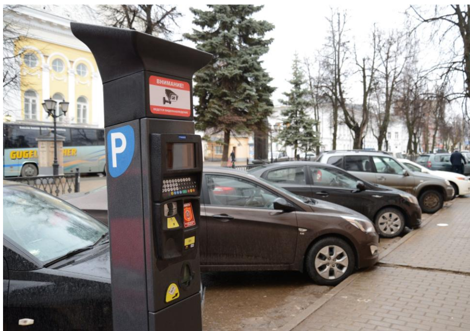
Рисунок 3. Платная парковка.

Улично-дорожную сеть увязывают с планировочной структурой поселения и прилегающей к нему территорией, обеспечивая удобные, быстрые и безопасные транспортные связи со всеми функциональными зонами, с другими поселениями системы расселения, объектами, расположенными в пригородной зоне, объектами внешнего транспорта и автомобильными дорогами общей сети.