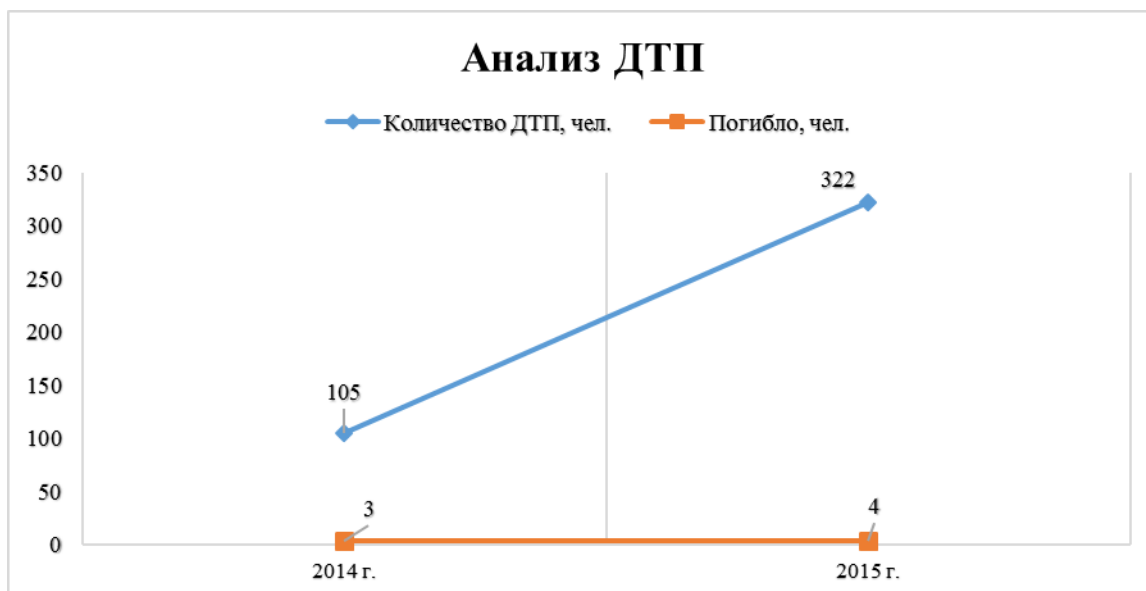
Диаграмма 4. Анализ ДТП Муниципального района.