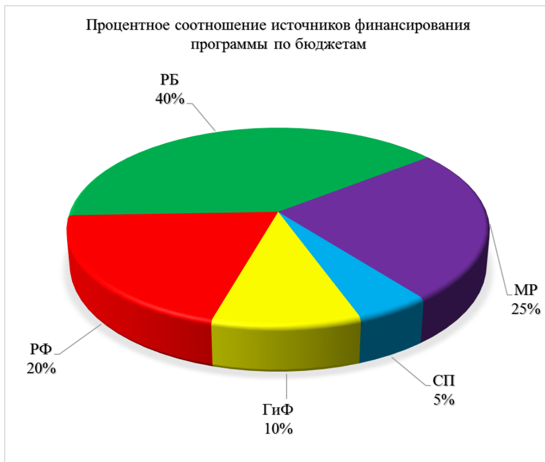
Диаграмма 8. Процентное соотношение источников финансирования программы по бюджетам.