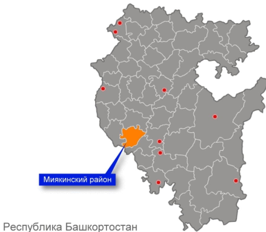
Рисунок 1. Месторасположение Муниципального района Миякинский район на карте Республики Башкортостан.

Территория поселения Миякибашевский сельсовет расположена в восточной части территории Миякинского района Республики Башкортостан.