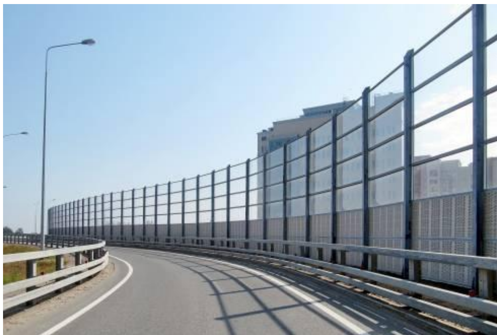
Рисунок 5. Защитное ограждение «защитный экран».

Среди альтернативных типов топлив в настоящее время привлекает внимание целый ряд продуктов различного происхождения: сжатый природный газ, сжиженные газы нефтяного происхождения и сжиженные природные газы, различные синтетические спирты, газовые конденсаты, водород, топлива растительного происхождения и т.д.