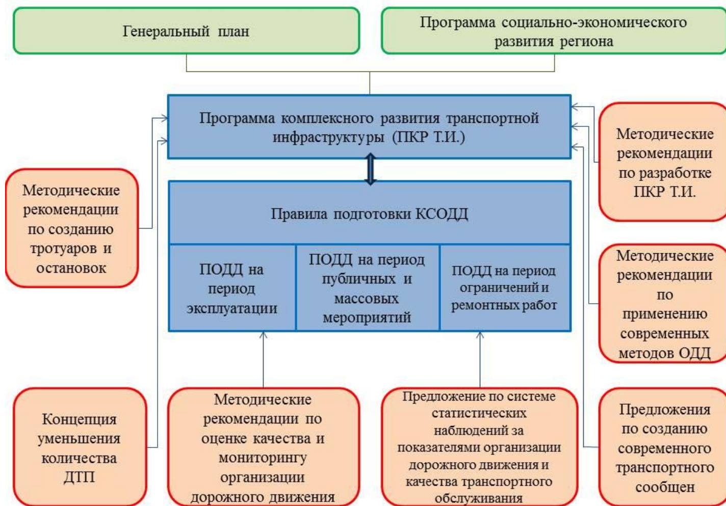
Рисунок 7. Модель Программы комплексного развития транспортной инфраструктуры сельского поселения Миякибашевский сельсовет Миякинский район на 2016-2020 годы с перспективой до 2032 года.