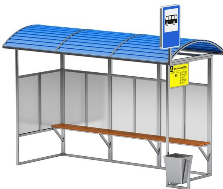
Рисунок 2. Остановка общественного транспорта.

Территория ТПУ, как правило, является собственностью двух или более транспортных фирм либо обслуживает сразу несколько видов транспорта одной фирмы. В отличие, например, от обычных автобусных остановок, на территории ТПУ могут устанавливаться внутренние правила, регламентируемые оплатой проезда в транспорте.