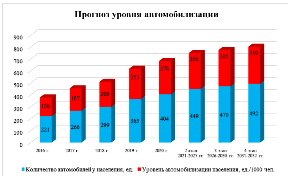
Диаграмма 6. Прогноз уровня автомобилизации.