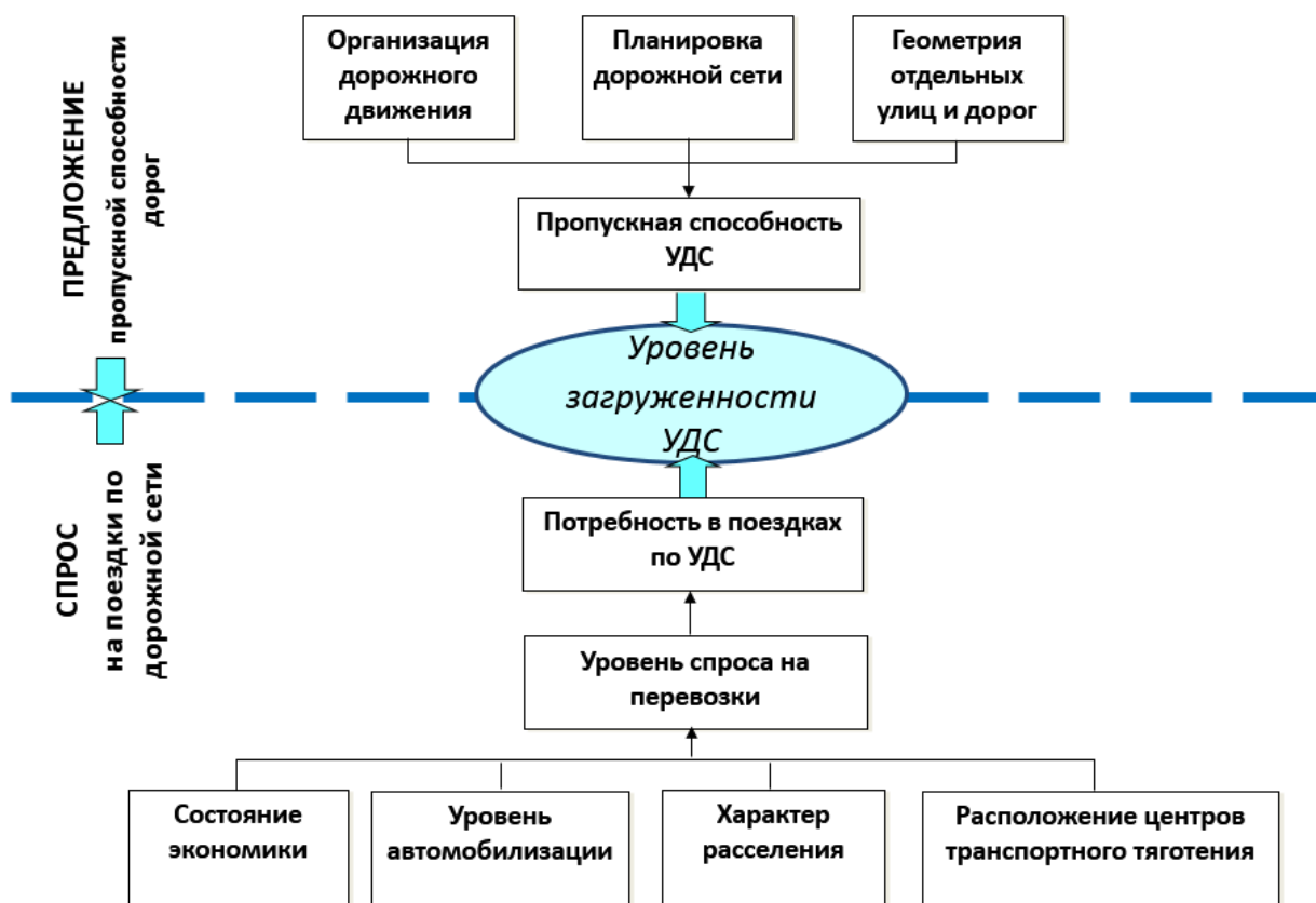
Рисунок 4. Факторы, определяющие уровень загрузки ДС.

5.1. Комплексные мероприятия по организации дорожного движения, в том числе мероприятия по повышению безопасности дорожного движения, снижению перегруженности дорог и (или) их участков.