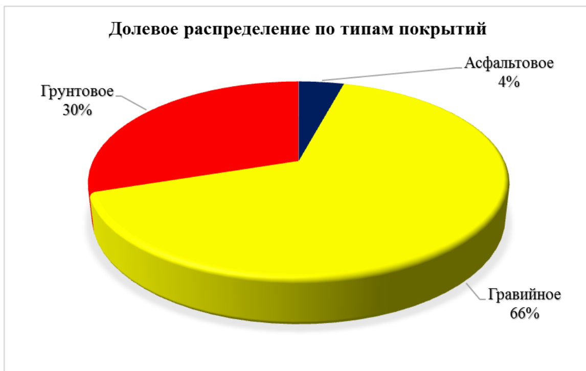
Диаграмма 2. Долевое распределение по типам покрытий автодорог сельского поселения.

2.5. Анализ состава парка транспортных средств и уровня автомобилизации, обеспеченность парковками (парковочными местами).