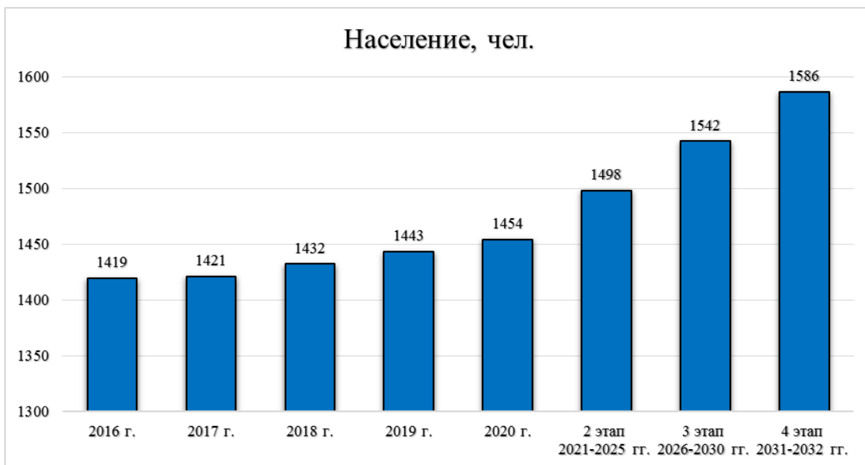
Диаграмма 5. Прогнозная численность населения.