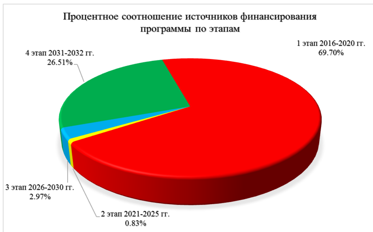
Диаграмма 9. Процентное соотношение источников финансирования программы по этапам.