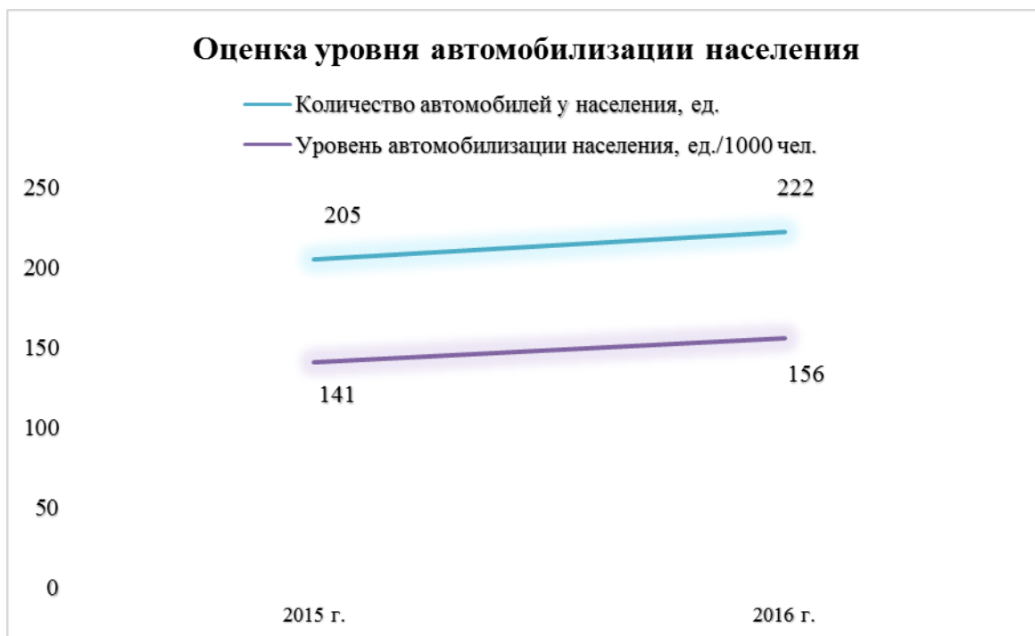
Диаграмма 3. Оценка уровня автомобилизации населения.

Специализированные парковочные и гаражные комплексы отсутствуют. Для хранения транспортных средств используются неорганизованные площадки с самовольно возведенными гаражами преимущественно в металлическом исполнении. Временное хранение транспортных средств также осуществляется на дворовых территориях жилых комплексов.