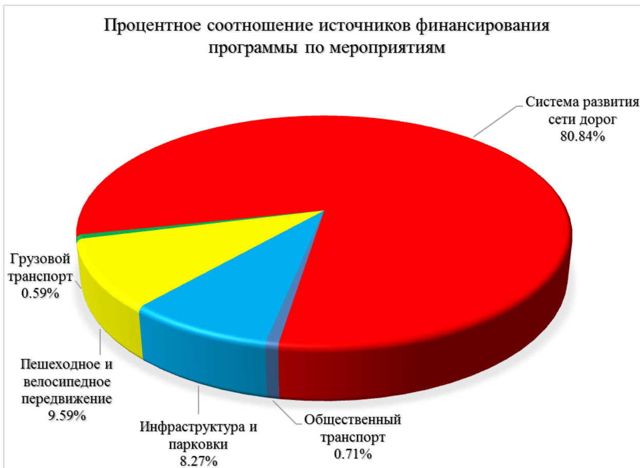
Диаграмма 10. Процентное соотношение источников финансирования программы по мероприятиям.